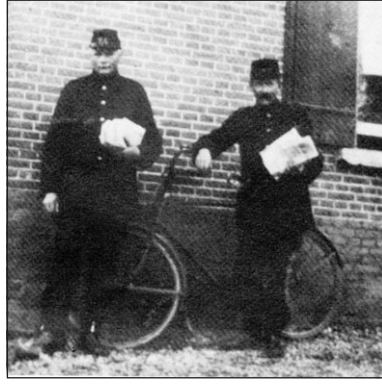
Postbodes uit de oude doos.